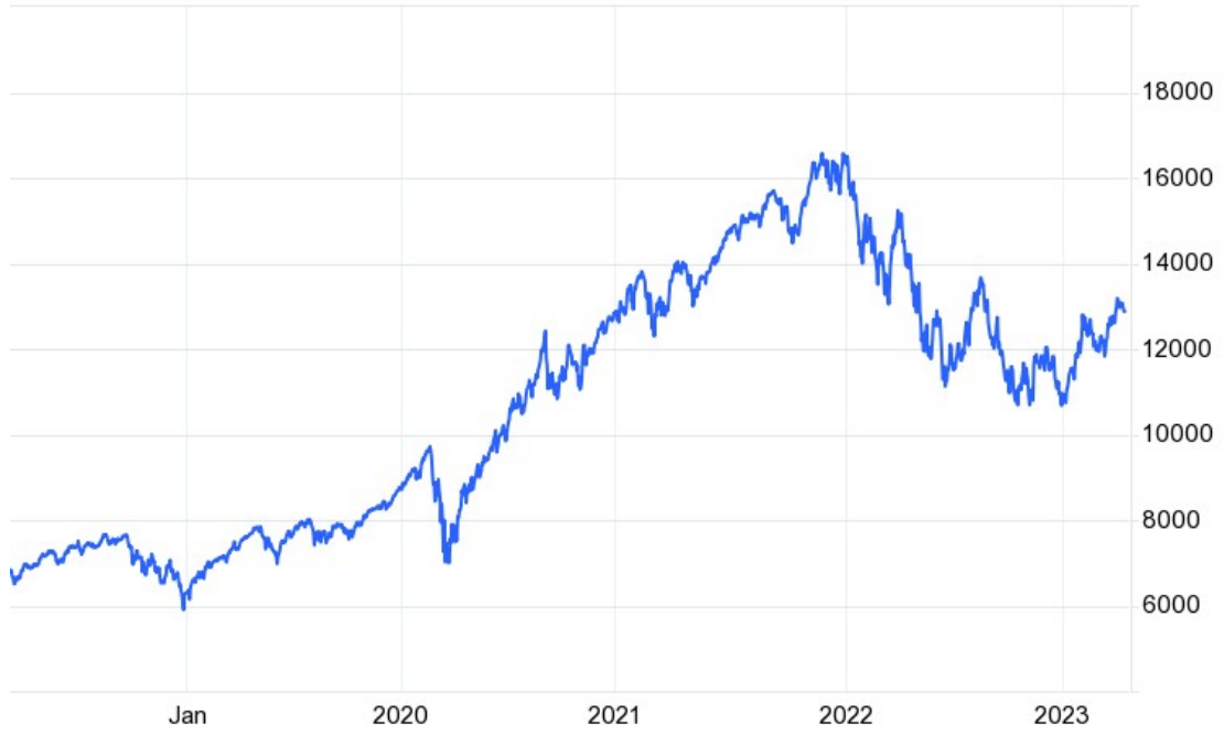
US Tech 100 Index