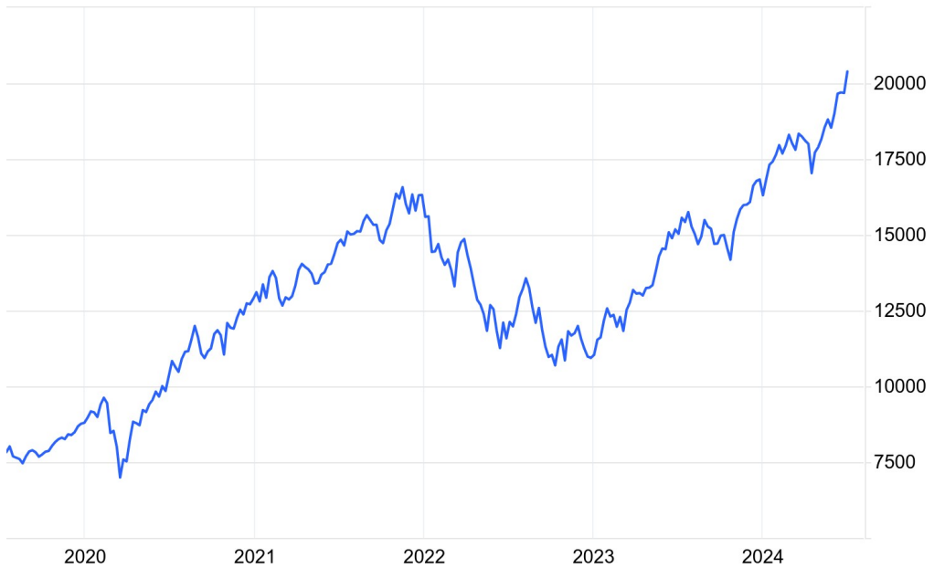
US 100 Tech Index

אולם עד אז אפשר להמשיך בזה: מדד נאסדק 100 (מניות טכנולוגיה "מובילות").