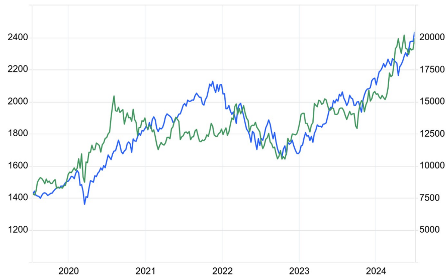
US100 | Gold

ואותו מדד מניות ביחד עם "התאוס" שלו: מדד נאסדק 100 - בכחול ציר ימני. מחיר זהב - בירוק ציר שמאלי.